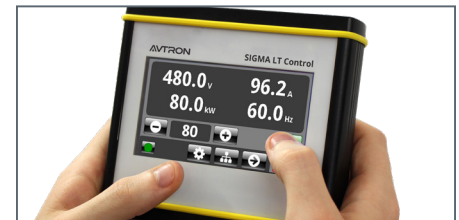
Bedienfeld mit „digitalem Umschalter“ und optionalem SIGMA LT-Handcontroller.